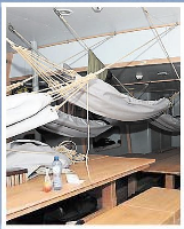
• Behalve kooien zijn er ook hangmatten om alle trainees een zitplek te kunnen bieden.

AAN BOORD van 's werelds grootste topzeilschoener WYLDE SWAN